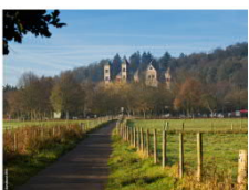
Benediktiner Klöster: Abtei Maria Laach, Abtei Plankstetten und Abtei Münsterschwarzach

++ Wir begleiten Sie ++ Leben aus der Mitte ++ dem Leben einen neuen Sinn geben ++