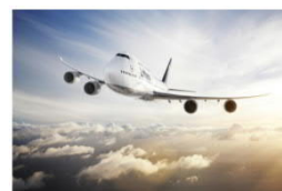
Airline-Coaching: Coping Strategies Prävention Einzelcoaching