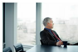
Führungskräfte-Coaching: Prävention und Krisenintervention Einzelcoaching