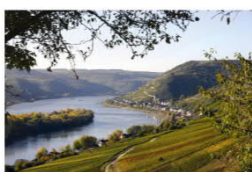
Rheingau-Tages-Tour: Miteinander unterwegs sein Einzelcoaching